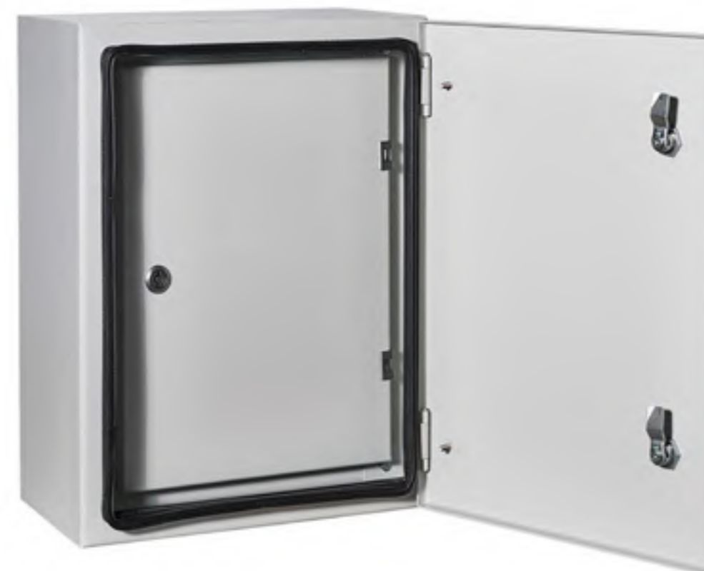
Корпус с дополнительной дверцей

— Сплошной лазерный шов обеспечивает высокую степень пылевлагозащиты, эстетичный конечный результат и точную геометрию корпуса.